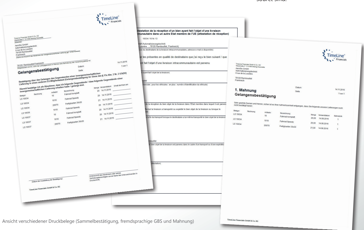
Ansicht verschiedener Druckbelege (Sammelbestätigung, fremdsprachige GBS und Mahnung)

Haben wir Ihr Interesse geweckt? Gerne nehmen wir unter timeline@tlfi.de Ihre Fragen und Ihre Voranmeldung für eine kostenfreie Präsentation entgegen.